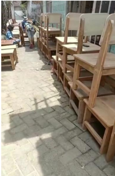
Hasil produksi UD. Manut Kediri