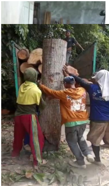
Proses produksi UD. Manut Kediri