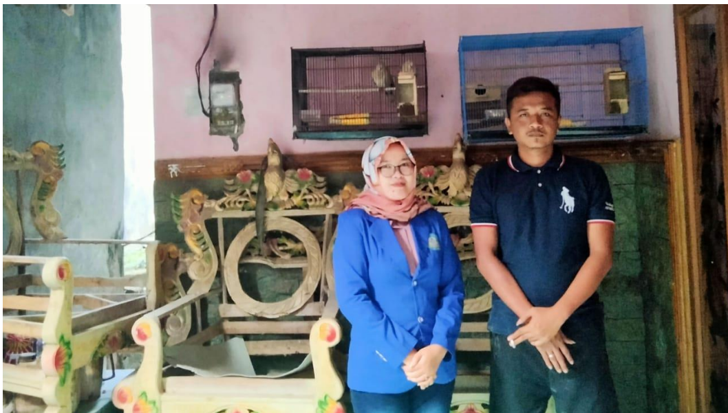
Pemilik/Owner UD. Manut Kediri