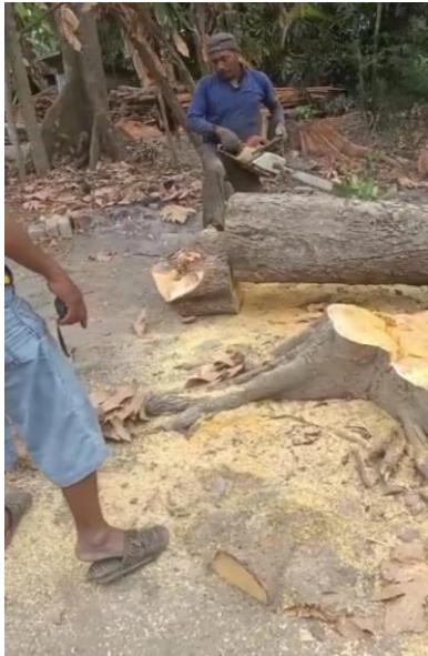
Penggunaan lahan milik warga