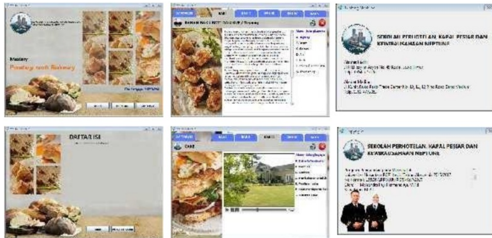
Gambar 2. Tampilan media pembelajaran interaktif

konvensional yang membuat suasana kelas kurang menarik membuat pesan pembelajaran tidak mudah dipahami. Namun melalui penggunaan buku/modul ajar dan media pembelajaran interaktif yang tepat oleh instruktur, kegiatan pembelajaran menjadi lebih terarah dan bermakna.