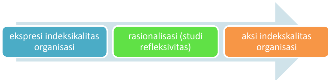
Gambar 3.1 Order antara ekspresi dan aksi Indeksikalitas

Tahap ketiga studi etnometodologi dalam penelitian ini adalah mengungkapkan aktivitas keseharian bersifat praktis yang dapat dikenali ( recognizable ) dan dapat dilaporkan ( visible ). Mahkota penelitian etnometodologi adalah suatu penjelasan tentang keteraturan dan keterkaitan antara ekspresi indeksikalitas, rasionalisasi atas ekspresi indeksikalitas dan akan berakhir pada sebuah aksi indeksikalitas. Hal ini akan terlihat seperti gambar dibawah ini :