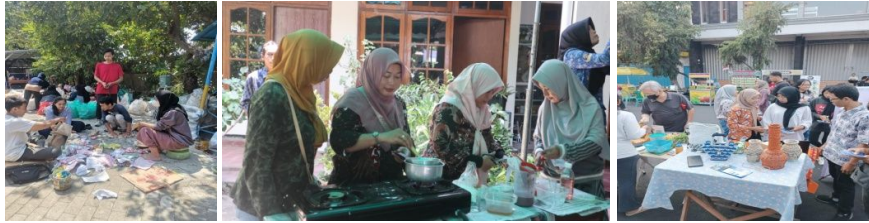
Gambar 1. Proses memilah, mengolah hingga memasarkan produk hasil daur ulang sampah

aktivitas untuk mengurangi sampah di Kota Kediri, hal ini dibuktikan dengan proses pemilahan sampah, mengolah sampah yang tersortir, lalu memasarkan produk tersebut ke masyarakat di Kota Kediri.