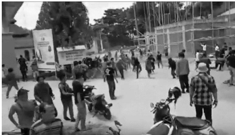
Gambar 1.1 Foto Bentrok Dua Organisasi Mahasiswa Sumber foto news.okezone.com tahun 2021

Banyak sekali informasi mengenai konflik antar mahasiswa. Salah satunya tentang konflik antar organisasi mahasiswa yang dilansir dari news.okezone.com yaitu, pernah terjadi konflik yang tidak diketahui motifnya antara dua (2) organisasi mahasiswa yaitu HMI serta PMII Cabang Polewali Mandar (Polman), Sulawesi Barat. Konflik ini terjadi di Universitas Al'asyariah Mandar. Karena konflik yang terjadi, banyak mahasiswa yang terluka, bahkan aparat kepolisian terpaksa terjun ke lapangan guna meleraikan konflik yang terjadi. 2 (dua) organisasi saling serang dengan kayu serta batu. Banyak juga mahasiswa yang saling melemparkan batu ke lingkungan kampus yang mana berakibat pada beberapa kaca serta atap bangunan kampus rusak (Zainal, 2021).