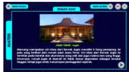
Gambar 7. Materi Rumah Adat