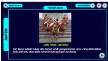
Gambar 8. Materi Tari Adat