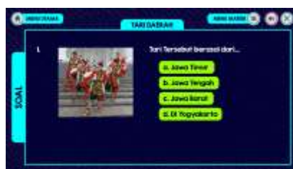
Gambar 10. Kuis