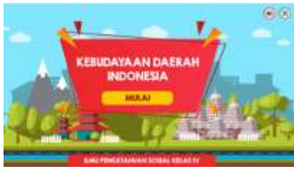
Gambar 2. Pembukaan