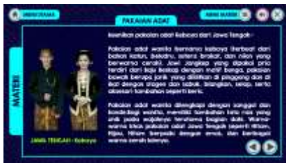
Gambar 6. Materi Pakaian Adat