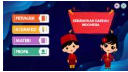
Gambar 3. Menu