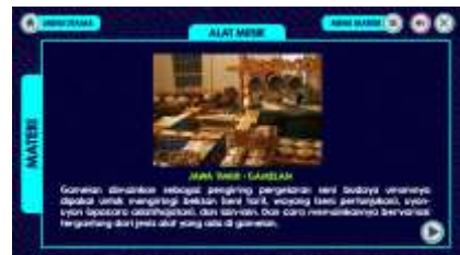
Gambar 9. Materi Alat Musik