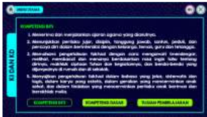
Gambar 4. KI, KD, Indikator dan Tujuan Pembelajaran