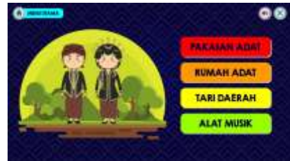
Gambar 5. Sub Materi