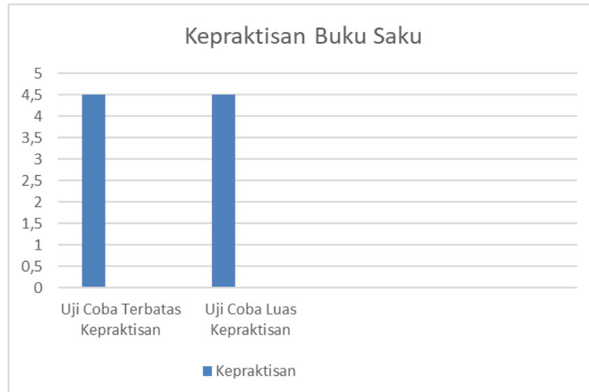
Gambar 1.3 Hasil Kepraktisan Produk

Berdasarkan gambar 1.3 hasil penilaian produk dari kepraktisan yang diuji cobakan pada uji coba terbatas (10 siswa) dan uji coba luas (27) dengan jumlah keseluruhan responden 37 siswa mendapatkan skor hasil 4,50 terletak pada rentang KB > 4,20 pada kepraktisannya media pembelajaran buku saku dikategorikan sangat layak untuk dikembangkan.