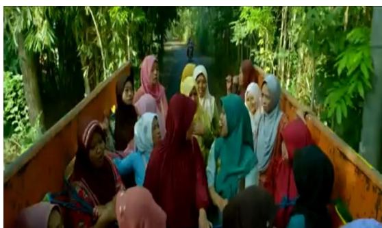
Gambar 020 Rombongan ibu-ibu berangkat bersama dari desa menuju rumah sakit untuk menjenguk Bu Lurah

Ibu-Ibu : Kasihan ya bu Lurah. Kelihatannya sakit-sakitan terus (T: 2018, ad: 01)