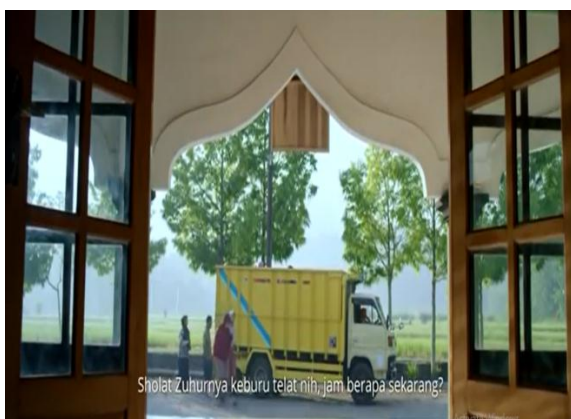
Gambar 026 Truk berhenti di mushola. Ibu-ibu turun untuk melaksanakan sholat zuhur.