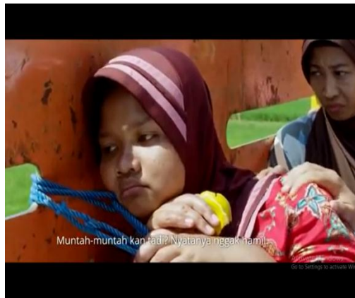
Gambar 012 Berperan sebagai Yu Nah

Tokoh Yu Nah tidak diketahui nama aslinya siapa. Meskipun tidak ada dialog dan sekilas namun adegan Yu Nah cukup menghibur. Di saat semua tegang membicarakan tentang bahayanya informasi di internet menelan korban warga desa yang tertipu iklan obat herbal di internet. Tiba-tiba Yu Nah mengangkat tangan dikira pernah tertipu juga ternyata malah mabuk kendaraan dan ingin muntah sehingga membuat ibu-ibu panik. Yu Nah hanya sebagai tokoh figuran yang mencairkan suasana dan menimbulkan kesan komedi dalam film ini.