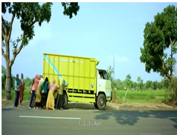
Gambar 023 Ibu-ibu bersama-sama mendorong truk yang mogok agar bisa hidup kembali untuk meneruskan perjalanan.