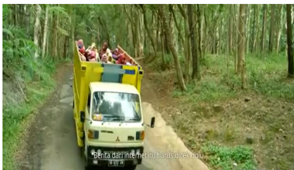
Gambar 021 Berlatarkan jalanan desa dan truk berisi rombongan ibu-ibu. Namun percakapan antara ibu-ibu di dalamnya terdapat nasihat dan saran yang baik.

Yu Nin : Berita di internet harus dicek terlebih dahulu. Nggak Cuma ditelan mentah-mentah.