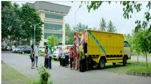
Gambar 001 Rombongan tilik bu Lurah sampai di rumah sakit.