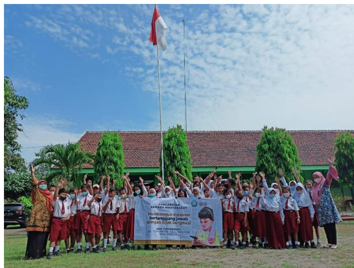
Gambar 2. Pelaksanaan Pengabdian kepada Masyarakat Pemanfaatan Pemanfaatan Gawai sebagai Media Menanamkan Karakter Tanggung Jawab Pada Siswa SDN Toyoresmi

Pemberian penyuluhan ini menyesuaikan dengan pola bahasa yang mudah dipahami anak sesuai dengan usianya. Selama proses dilakukan sesi tanya jawab untuk mengetahui apakah yang disampaikan di penyuluhan tersebut dapat dipahami anak. Dengan menunjuk peserta untuk menjawab pertanyaan yang dibuat. Sehingga apa yang disajikan dalam materi penyuluhan dapat dipahami dan diserap oleh siswa dengan baik.