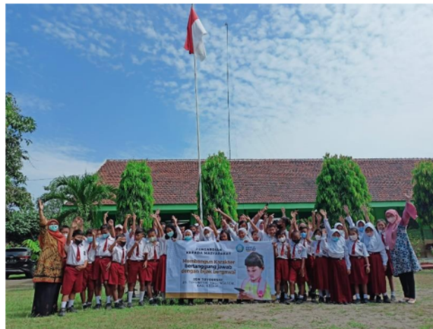
Gambar 2. Pelaksanaan Pengabdian kepada Masyarakat Pemanfaatan Pemanfaatan Gawai sebagai Media Menanamkan Karakter Tanggung Jawab Pada Siswa SDN Toyoresmi

Pemberian penyuluhan ini menyesuaikan dengan pola bahasa yang mudah dipahami anak sesuai dengan usianya. Selama proses dilakukan sesi tanya jawab untuk mengetahui apakah yang disampaikan di penyuluhan tersebut dapat dipahami anak. Dengan menunjuk peserta untuk menjawab pertanyaan yang dibuat. Sehingga apa yang disajikan dalam materi penyuluhan dapat dipahami dan diserap oleh siswa dengan baik.