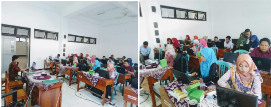
Gambar 3. Pelaksanaan kegiatan Workshop

Pelaksanaan pengabdian masyakat yang sudah dilakukan ditunjukkan oleh gambar di bawah ini.