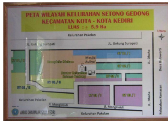
Gambar 4.1. Peta Wilayah

sebesar 155 hari. Disamping itu curah hujan mengalami penurunan dari 5.174 mm pada tahun 2010 menjadi 2.697 mm pada tahun 2011.