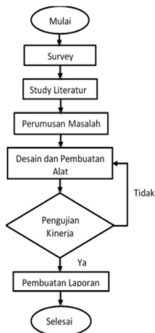
Gambar 1. Flowchart

Dibawah ini langkah-langkah yang perlu dilakukan untuk melakukan rancang bangun wadah penampung pelet pada alat pelontar adalah sebagai berikut: