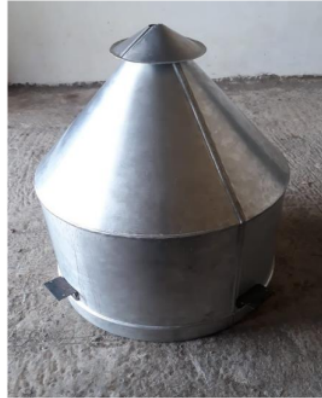
Gambar 4. Wadah penampung pakan ikan

Fungsi sensor berat yaitu untuk menimbang pelet ikan pada saat waktu pemberian pakan. jadi katup selenoit otomatis akan membuka dan pelet akan jatuh kebawah, jika sudah mencapai batas yang di tentukan katup selenoit otomatis menutup, setelah itu pelet yang jatuh kebawah akan dilontarkan oleh impeller. Sementara fungsi dari sensor ultrasonik yaitu untuk menandakan jika pelet yang ada di penampung sudah habis maka sensor ini akan berbunyi.