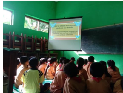
Gambar 4. Pembelajaran digital.