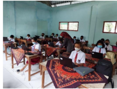
Gambar 3. Pelaksanaan AKM kelas.