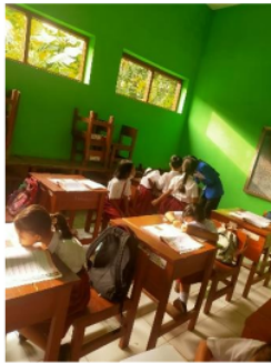
Gambar 2. Pelaksanaan menjadi mitra guru