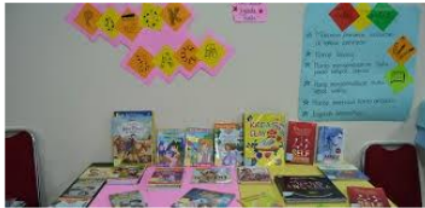
Gambar 6. Pembuatan pojok baca