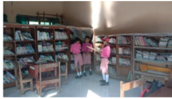
Gambar 5. Pemulihan fungsi perpustakaan