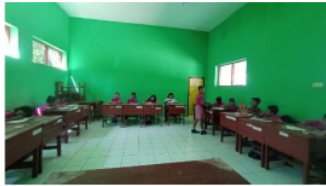
Gambar 1. Pelaksanaan pembelajaran secara kelompok