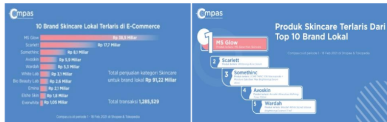
Gambar 1. Skincare Lokal Terlaris 2021