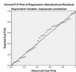
Gambar 1 Hasil Uji Normalitas Probability Plots