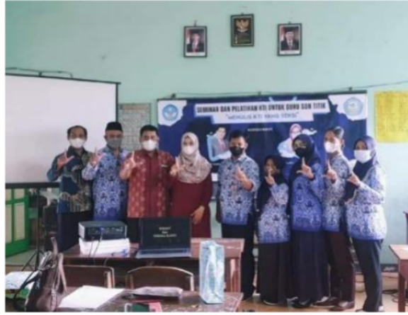
Gambar 2. Dokumentasi Dosen PBSI dengan Guru SD Negeri Titik

guru. SD ini tidak memiliki tenaga kependidikan sehingga guru merangkap menjadi administrator di sekolah. Dokumentasi Pengabdian seperti pada gambar 2.