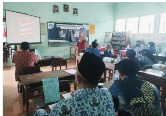
Gambar 3. Dokumentasi Kegiatan Sosialisasi dan Pelatihan

Adanya program kerja yang dimiliki oleh dosen Pendidikan Bahasa dan Sastra Indonesia, maka membuka peluang kerjasama yang akan dilakukan secara konsisten disetiap semester dengan tema-tema yang berbeda, tentunya sebagai pemecah dari masalah yang dihadapi oleh guru. Kegiatan kerjasama dalam bidang akademik diharapkan mampu meningkatkan wawasan guru sehingga guru-guru mampu menghadapi tantangan pendidikan yang semakin sulit. Menurut (Arfianto & Balahmar, 2014) pengertian pemberdayaan masyarakat merupakan strategi untuk mewujudkan kemampuan dan kemandirian masyarakat sehingga mereka mampu mewujudkan kemajuan, kemandirian, dan kesejahteraan dalam suasana keadilan sosial yang berkelanjutan.