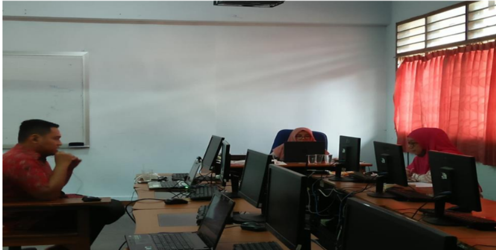
Gambar 2. Pemaparan Materi I

Materi kedua disampaikan oleh Dr. Vivi Ratnawati, S.Pd., M.Psi dan Restu Dwi Ariyanto, M.Pd mengenai optimisme mahasiswa dalam pembelajaran daring yang difokuskan pentingnya sikap optimis dimiliki mahasiswa dalam melaksanakan pembelajaran, baik secara daring maupun luring, serta juga dijelaskan oleh Bapak Restu tentang cara praktis pengembangan optimis mahasiswa dalam melaksanakan pembelajaran di jaman milenial ini. Materi dikemas dalam penyampaian ceramah lalu diskusi antara pemateri dan mahasiswa.