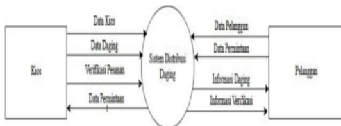
Gambar 1 Diagram Konteks

Gambar 1 merupakan diagram konteks dari sistem informasi distribusi daging.