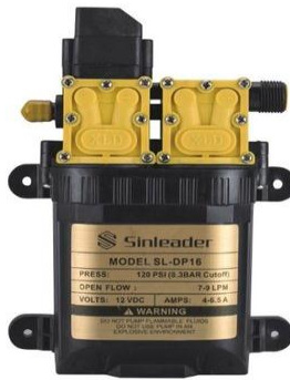
Gambar 3 Pompa Air DC