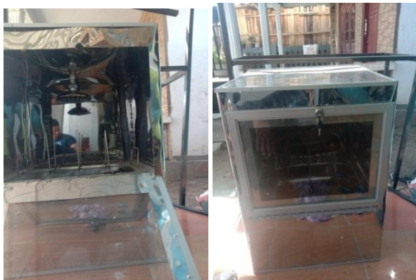
Gambar 2. Alat pencuci gelas otomatis berbasis arduino