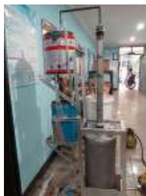
Gambar 1. Distilator Refluks

Berikut merupakan merupakan alat distilator refluks yang digunakan untuk penelitian: