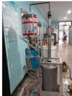
Gambar 1. Distilator Refluks

Berikut merupakan merupakan alat distilator refluks yang digunakan untuk penelitian: