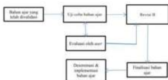
Gambar 2 Prosedur Pengembangan Bahan Ajar Berbasis Kasus Tahap Kedua (Mentari & Laily, 2016)

Prosedur penelitian pengembangan bahan ajar berbasis kasus pada tahap pertama sebagaimana gambar 1 meliputi kegiatan: telaah silabus/RPS, analisis kegiatan pembelajaran, disain dan pengembangan bahan ajar, validasi ahli, dan revisi awal. Keseluruhan proses kegiatan pada tahap pertama menghasilkan produk berupa bahan ajar berbasis kasus yang telah direvisi. Secara lebih rinci kegiatan penelitian pengembangan bahan ajar berbasis kasus disajikan pada tabel 1 berikut ini.