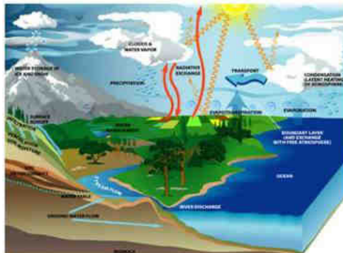
interaksi lingkungan biotik dan abiotik