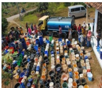
Soal no. 2