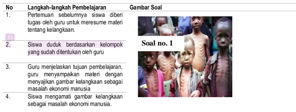
Tabel 1. Langkah-langkah Implementasi REPICPRO

Proses penelitian melalui 2 tahap pertemuan, yaitu pertemuan 1 membahas tentang pengertian kelangkaan, penyebab terjadinya kelangkaan dan cara untuk mengatasi kelangkaan. Pertemuan 2 Pengertian kebutuhan, Jenis-jenis kebutuhan manusia dan Alat pemuas kebutuhan.