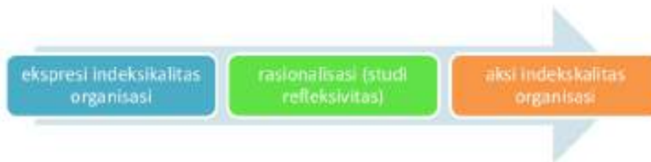
Gambar 3.1 Order antara ekspresi dan aksi Indeksikalitas

Tahap ketiga studi etnometodologi dalam penelitian ini adalah mengungkapkan aktivitas keseharian bersifat praktis yang dapat dikenali ( recognizable ) dan dapat dilaporkan ( visible ). Mahkota penelitian etnometodologi adalah suatu penjelasan tentang keteraturan dan keterkaitan antara ekspresi indeksikalitas, rasionalisasi atas ekspresi indeksikalitas dan akan berakhir pada sebuah aksi indeksikalitas. Hal ini akan terlihat seperti gambar dibawah ini :