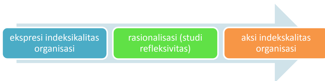
Gambar 3.1 Order antara ekspresi dan aksi Indeksikalitas

Tahap ketiga studi etnometodologi dalam penelitian ini adalah mengungkapkan aktivitas keseharian bersifat praktis yang dapat dikenali ( recognizable ) dan dapat dilaporkan ( visible ). Mahkota penelitian etnometodologi adalah suatu penjelasan tentang keteraturan dan keterkaitan antara ekspresi indeksikalitas, rasionalisasi atas ekspresi indeksikalitas dan akan berakhir pada sebuah aksi indeksikalitas. Hal ini akan terlihat seperti gambar dibawah ini :