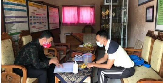
Penyerahan Surat Ijin Penelitian