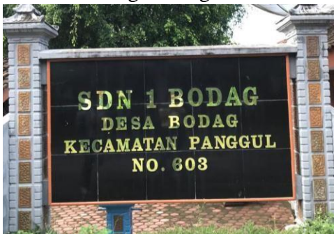
Nambor SDN 1 Bodag