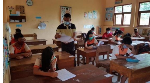
Pembagian Angket kelas IV