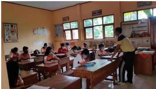
Pembagian Angket kelas V