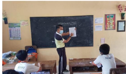
Pembagian Angket kelas VI