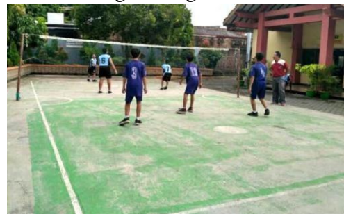
Olahraga Sepak Takraw Siswa SDN 1 Bodag Kecamatan Panggul