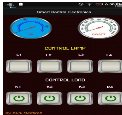
Gambar 4 Display Aplikasi pada Layar Hp

Dari alat penelitian yang telah dirangkai, maka dilakukan pengendalian daya semu pada beberapa piranti elektronik, berikut merupakan hasil dari pengendalian dan pengukuran daya semu melalui peralatan dari hasil penelitian yang mana hasil pengukurannya dibandingkan dengan alat ukur lain yaitu digital power metter untuk mengetahui apakah peralatan tersebut mempunyai daya ukur yang sama atau hampir sama dengan peralatan yang lainnya: