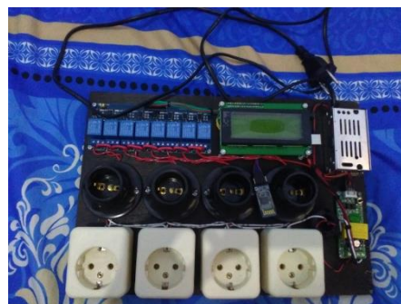
Gambar 3 Alat hasil Penelitian

Dari penelitian dihasilkan alat seperti gambar di bawah ini: