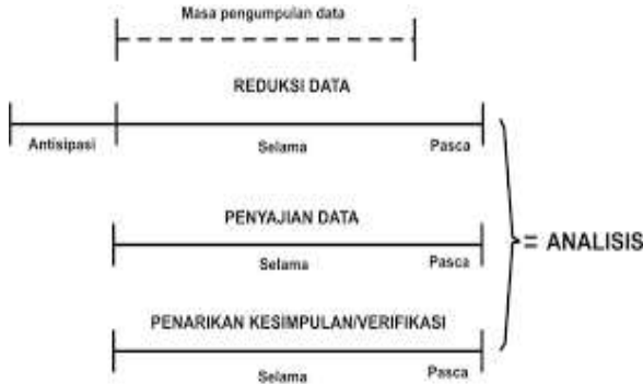
Gambar 1. Flow Model analisis data

dari informan telah siap, peneliti melakukan langkah analisis data yang meliputi :