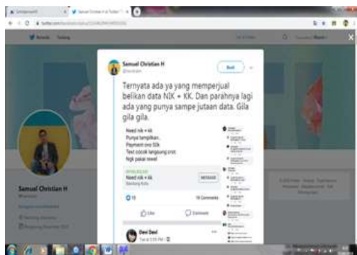
Gambar 3. Keluhan tentang Fintech Lending di Twitter

Selain dari twitter , peneliti mencoba mencari informasi dari ulasan pengguna financial technology lending di Play store .