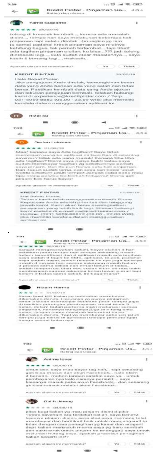
Gambar 4. Keluhan tentang Fintech Lending

Lebih lanjut, peneliti menyajikan hasil temuan secara deskriptif dari beberapa