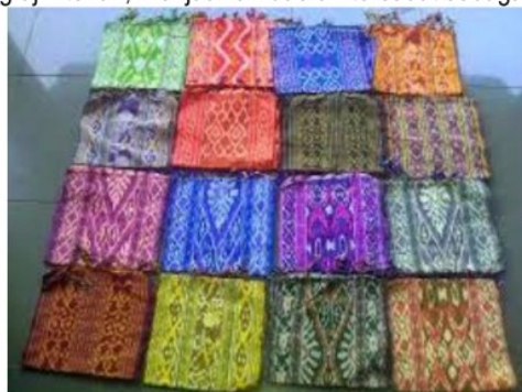
Gambar 3. Tenun Khas Jepara

Ada peraturan keras bahwa seseorang hanya boleh memakai motif tenun yang diizinkan. Meluasnya kesenian tenun ini hampir di setiap wilayah Indonesia ialah sekitar akhir abad XVIII. Banyak industri tenun yang telah berdiri diantaranya adalah di daerah Toraja, Sintang, Jepara, Bali, Lombok, Sumbawa, Sumba, Flores, dan Timor telah menjadi pelopor industri batik, berawal dari ratusan pengusaha kecil yang telah tumbuh, dari ratusan pengrajin tersebut menghasilkan banyak produk tenun. Karena banyaknya pengrajin tenun, menjadikan daerah tersebut sebagai sentra penghasil tenun.