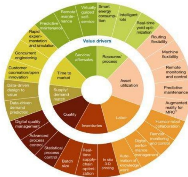
Gambar 2. Level industri 4.0

Baur dan Wee (2015) memetakan industri 4.0 dengan istilah “kompas digital” sebagai berikut :