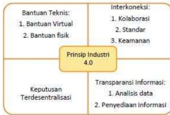
Gambar 1. Prinsip Industri 4.0

Industri 4.0 telah memperkenalkan teknologi produksi massal yang fleksibel (Kagermann et al, 2013). Mesin akan beroperasi secara independen atau berkoordinasi dengan manusia (Sung, 2017). Industri 4.0 merupakan sebuah pendekatan untuk mengontrol proses produksi dengan melakukan sinkronisasi waktu dengan melakukan penyatuan dan penyesuaian produksi (Kohler & Weisz, 2016). Selanjutnya, Zesulka et al (2016) menambahkan, industri 4.0