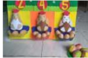
Gambar 3. Menghitung jumlah telur sesuai angka yang muncul

Media Telur Angka ini dirancang sedemikian rupa supaya mudah untuk digunakan oleh siapapun. Cara penggunaannya adalah sebagai berikut: