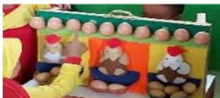
Gambar 1. Membilang telur