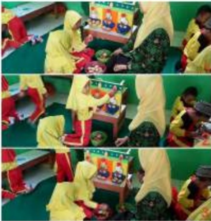
Gambar 7. Anak mengambil telur secara acak dan menebak angka yang muncul. Telur ditempel dipapan kemudian anak menghitung telur sesuai angka yang tertempel.