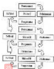
25 Gambar 4. Model Kemmis dan Taggart

Jenis penelitian yang digunakan adalah penelitian tindakan kelas dengan teknik analisis deskriptif kuantitatif menggunakan model Kemmis dan Taggart