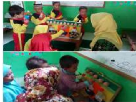
Gambar 5. Anak membilang telur

Bukti dokumentasi kegiatan yang dilakukan anak didik dalam mengenal konsep bilangan menggunakan media telur angka dapat diamati pada gambar-gambar di bawah ini: