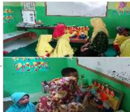
Gambar 6. Anak membilang angka