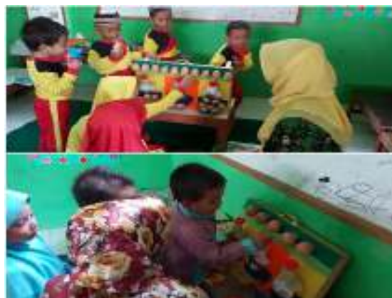
Gambar 5. Anak membilang telur

Bukti dokumentasi kegiatan yang dilakukan anak didik dalam mengenal konsep bilangan menggunakan media telur angka dapat diamati pada gambar-gambar di bawah ini: