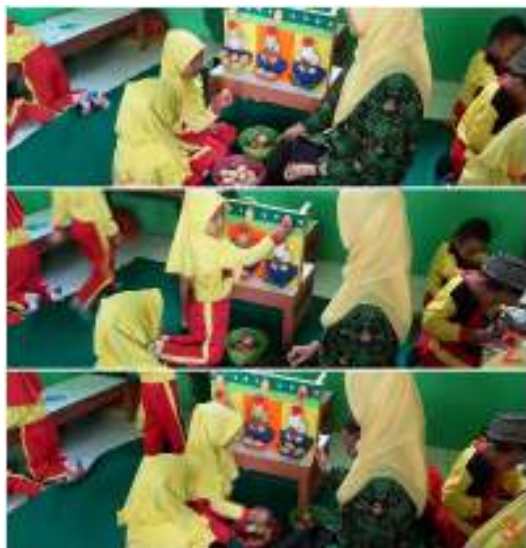
Gambar 7. Anak mengambil telur secara acak dan menebak angka yang muncul. Telur ditempel dipapan kemudian anak menghitung telur sesuai angka yang tertempel.