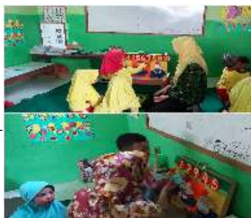
Gambar 6. Anak membilang angka