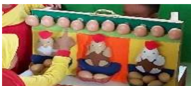
Gambar 1. Membilang telur