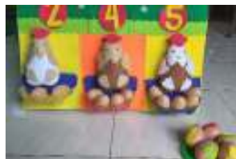
Gambar 3. Menghitung jumlah telur sesuai angka yang muncul

Media Telur Angka ini dirancang sedemikian rupa supaya mudah untuk digunakan oleh siapapun. Cara penggunaannya adalah sebagai berikut: