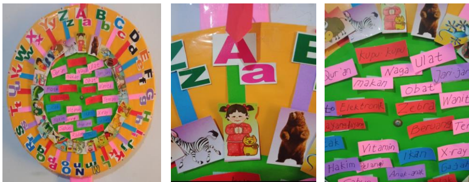
Gambar Media Putaran Kata

Putaran berarti gerakan berputar, alat untuk memutar atau sesuatu yang diputar. Sedangkan kata adalah apa yang dilahirkan dengan ucapan, ujar, bicara (Suharso dan Retnoningsih, 2009). Jadi berdasarkan penjelasan tentang definisi media sebelumnya, dapat disimpulkan bahwa Media Putaran Kata dalam tulisan ini adalah perantara atau sarana atau alat untuk proses komunikasi dalam belajar-mengajar, khususnya untuk pembelajaran membaca permulaan bagi anak usia dini, yang digunakan dengan cara diputar dan di dalamnya tercantum beberapa huruf dan kata untuk dimainkan, yang dapat merangsang anak untuk aktif berpikir, mendengarkan dan berbicara.