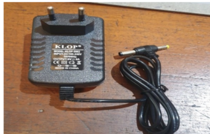
Gambar 2. 5Power Supply

Power supply adalah perangkat yang menyediakan sumber energi listrik untuk satu atau lebih beban listrik. Peran utama power supply ini sangat krusial dalam elektronika karena bertanggung jawab sebagai sumber energi, seperti baterai atau aki. Secara umum, konstruksi catu daya melibatkan rangkaian standar yang terdiri dari transformator, penyearah, dan penghalus tegangan. Istilah ini sering digunakan untuk merujuk pada perangkat yang mengubah satu bentuk energi listrik menjadi bentuk lainnya, meskipun bisa juga berlaku untuk perangkat yang mengubah bentuk energi lain (seperti mekanik, kimia, atau surya) menjadi energi listrik. Prinsip kerja catu daya melibatkan komponen utama seperti transformator, dioda, dan kondensator, serta komponen pendukung lainnya untuk optimalitas rangkaian. Ada dua jenis sumber catu daya, yaitu sumber AC yang menghasilkan tegangan bolak-balik, dan sumber DC yang menghasilkan tegangan searah. (Putra and Pulungan 2020)