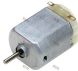
Gambar 2. 4 Motor dc 12v

Motor DC 12V adalah jenis motor listrik yang menggunakan arus searah (DC) dan dirancang untuk beroperasi pada tegangan 12 volt. Motor ini umumnya digunakan dalam berbagai aplikasi seperti mainan, peralatan rumah tangga kecil, dan perangkat otomotif. Motor DC bekerja dengan cara arus listrik mengalir melalui lilitan kawat pada rotor yang menghasilkan medan magnet. Interaksi antara medan magnet rotor dan stator menyebabkan rotor berputar. Kecepatan dan arah putaran motor dapat diatur dengan mengatur tegangan dan arus masuk ke motor. Prinsip kerja motor DC didasarkan pada gaya yang dihasilkan pada penghantar arus yang ditempatkan dalam medan magnet, menghasilkan torsi untuk memutar rotor dan mengubah energi listrik menjadi gerakan mekanis. (Rahayuningtyas 2009)