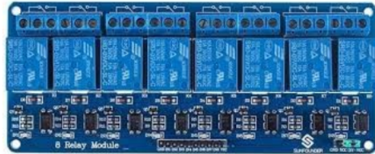
Gambar 2. 3 Relay 8 Modul

terdiri dari dua bagian utama, yaitu kumparan elektromagnetik (coil) dan sakelar mekanis. Ketika kumparan elektromagnetik diaktifkan oleh listrik, ia menggerakkan sakelar mekanis untuk membuka atau menutup jalur arus listrik. Relay memanfaatkan prinsip elektromagnetik untuk mengendalikan kontak sakelar, dimana struktur paling dasarnya terdiri dari kumparan kawat yang dililitkan di sekitar inti besi. (Saleh and Haryanti 2017)