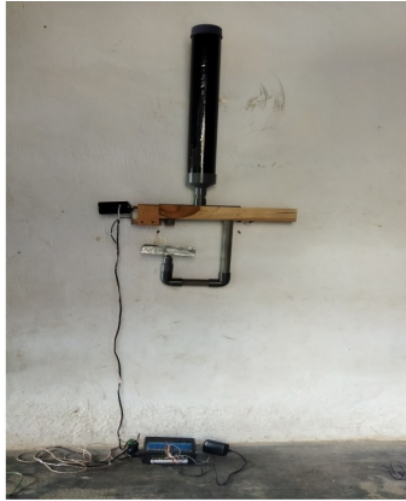
Gambar 4. 1 Alat Pemberi Pakan Ikan Otomatis

Berdasarkan hasil penelitian lapangan, desain produk dikembangkan untuk uji coba setelah produk selesai dibuat. Berikut adalah gambaran alat saat digunakan untuk memberi 54 pakan ikan.