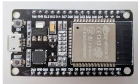
Gambar 2. 1 Modul Esp32

dilengkapi dengan modul WiFi dan prosesor dual-core berbasis instruksi Xtensa LX6. Mikrokontroler ESP32 sangat cocok untuk aplikasi Internet of Things (IoT) karena berbagai kemampuannya. Dengan kapasitas ROM sebesar 448 kB, SRAM 520 kB, dua memori RTC 8 kB, dan memori flash 4MB, ESP32 menawarkan performa yang baik. Mikrokontroler ini juga dilengkapi dengan 18 pin ADC (Analog-to-Digital Converter) 12-bit, empat unit SPI, dan dua unit I2C. Salah satu keunggulan utama ESP32 adalah harganya yang terjangkau serta kemudahan dalam pemrograman. ADC pada ESP32 memiliki resolusi 12-bit, memungkinkan pengukuran nilai dari 0 hingga 4095 untuk mengukur arus yang mengalir melalui terminal. (Widyatmika et al. 2021)