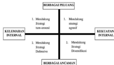
Gambar 1. Analisis SWOT

Menurut Rangkuti (2015) menjelaskan bahwa analisis SWOT adalah identifikasi sistematis dari berbagai faktor untuk membentuk strategi perusahaan. Analisis tersebut berdasarkan logika, agar kekuatan dan peluang dapat dimaksimalkan, namun di sisi lain kelemahan dan ancaman juga harus diminimalkan. Dalam perkembangannya, analisis SWOT tidak hanya digunakan untuk menyusun strategi secara umum, tetapi juga banyak digunakan dalam perumusan strategi perencanaan bisnis yang ditujukan untuk menyusun strategi jangka panjang demi kelangsungan hidup perusahaan. Sehingga instruksi dapat dibaca dan tujuan dapat dicapai serta keputusan tentang perubahan yang dibuat oleh pesaing segera ditanggapi. Analisis SWOT juga dapat membantu perusahaan menentukan ke arah mana bisnis akan berjalan dan bagaimana memaksimalkan kekuatan pelaku usaha untuk memanfaatkan peluang yang ada.